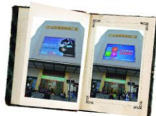
青岛北方国贸购物广场