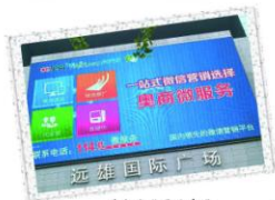
青岛远雄国际广场

微信以其独到的优势超越了传统的移动即时通信方式,进一步昭示着广告“微时代”的来临。当各大互联网企业还在传统营销和新兴的网络营销之间徘徊犹豫之际,微服务已经摩拳擦掌,为“微时代”的来临做好了充分的准备。一路走来,微服务迈着坚实的步伐已经遍布企业大大小小各个角落。